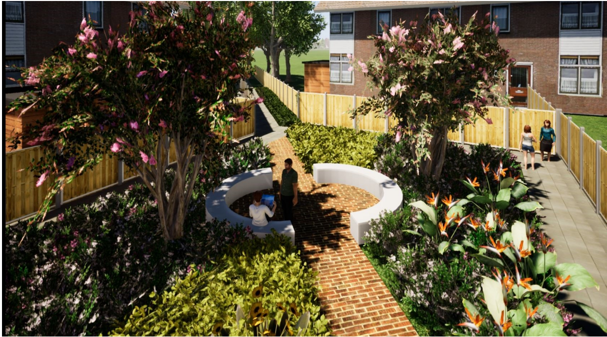
Afbeelding: 3D artist impressie. (Aan deze impressie kunnen geen rechten ontleend worden).