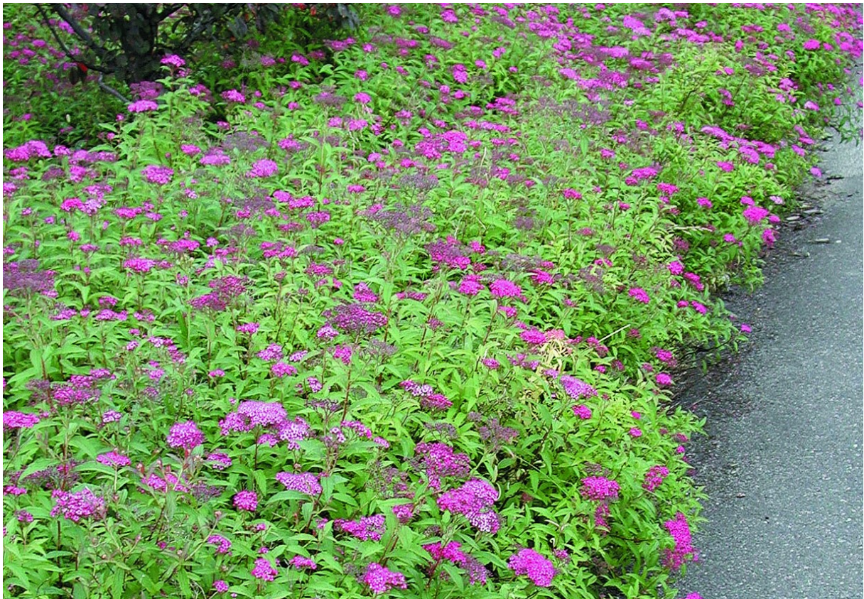
Impressie: Heester aan de randen van het veld: spirea.