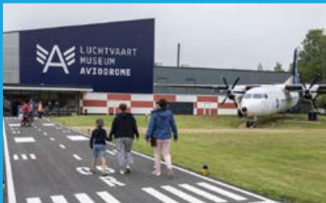
Luchtvaartmuseum Aviodrome, Lelystad Airport (175.000 bezoekers per jaar)

Met de groei van het toerisme, groeien ook de kansen voor ondernemers in Lelystad. Door de ligging aan het IJsselmeer en het Markermeer is Lelystad ideaal voor zowel zakelijke als recreatieve doeleinden. Nationale en internationale toeristen vinden met een eigen boot of via de riviercruises uitstekend hun weg naar een van de 5 jachthavens van Lelystad.