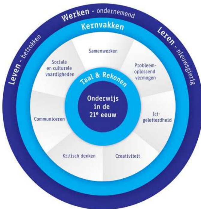
Figuur 1: 21 e -eeuwse vaardigheden

In zowel het rapport van de Onderwijsraad (2014) 'een eigentijds curriculum' als 'een lerende economie' van de Wetenschappelijke Raad voor het Regeringsbeleid (2013) wordt ingegaan op de vraag of het huidig onderwijs voldoende basis biedt voor de eisen die aan mensen gesteld worden in de huidige samenleving. Beide rapporten geven aan dat in de huidige samenleving zelfredzaamheid, innovatie en techniek steeds belangrijker zijn geworden en roepen op tot een heroriëntatie op het curriculum van het onderwijs. De eerste herijking van het curriculum zou speciale aandacht moeten besteden aan 21 e -eeuwse vaardigheden en een minder strikte scheiding tussen vaardigheden en cognitie.