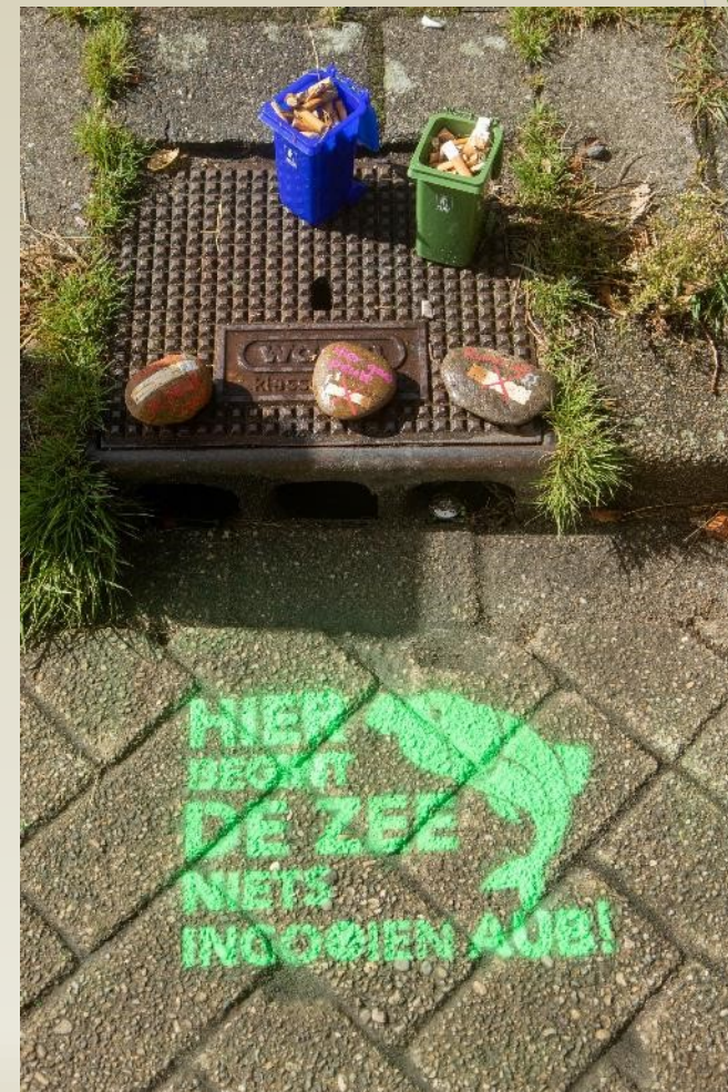
Bewustwordingscampagne: Hier begint de zee!