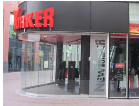
links: rolluik aan binnenzijde van de voorgevel. rechts: afsluitbare glazen pui.