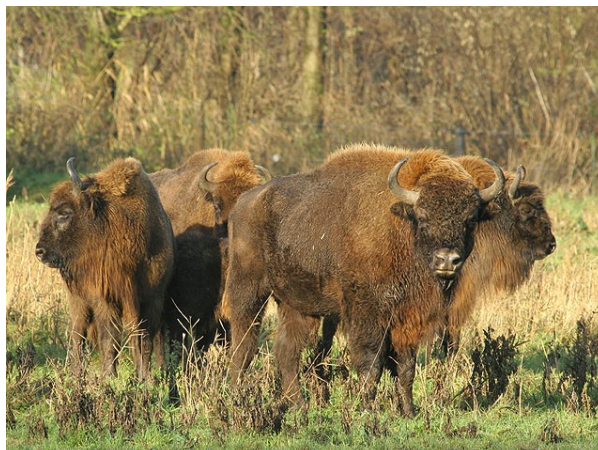
Wisenten in het Natuurpark

Een tweetal vragen ging over de belangrijkste recreatieve voorzieningen waar men in Lelystad gebruik van maakt. De eerste betrof de voorzieningen waar men zelf of met het eigen gezin naartoe gaat, de tweede brengt in beeld waar men het vaakst naartoe gaat met mensen die op bezoek komen.