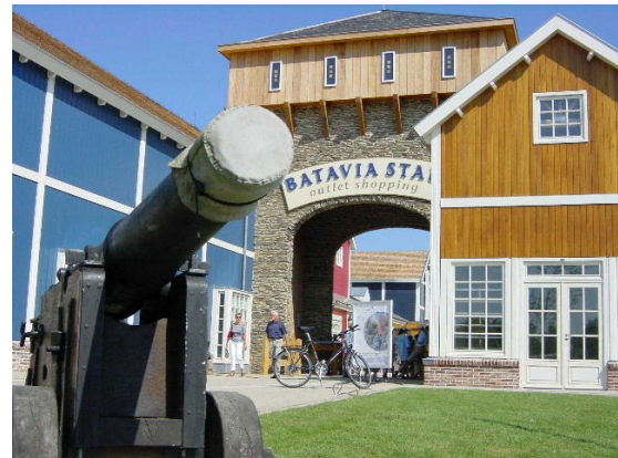
Ingang van Batavia Stad